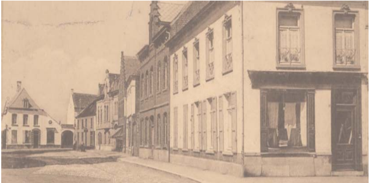
Foto 3: Het hoekhuis in Geel waar de familie Simon heeft gewoond.

Onvermijdelijk had dit tot gevolg dat er perioden waren dat er in deze school velen zich tot het priesterschap geroepen voelden. Zo is Florent in het college te Geel, in het schooljaar 1855-1856 een der 9 leerlingen van de "classe préparatoire". In de andere locaties waar de familie naartoe trok zal Florent zijn studies waarschijnlijk verder gezet hebben in de daar aanwezige colleges.