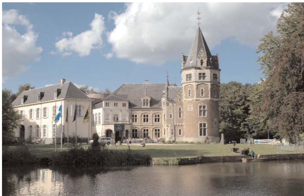
Foto: het kasteel de Renesse