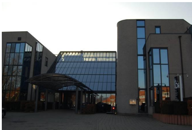
't Getouw Mol

Met negen aanwezige stemgerechtigde leden op elf kon er geldig vergaderd worden.