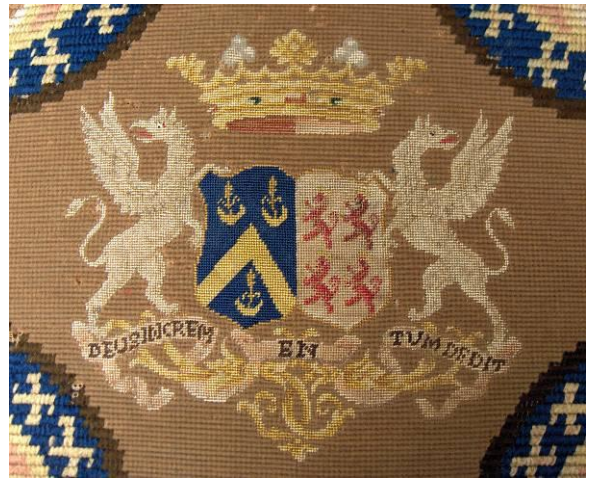
Detail met de wapenschilden, de markiezen kroon, wapendragers en leuze.