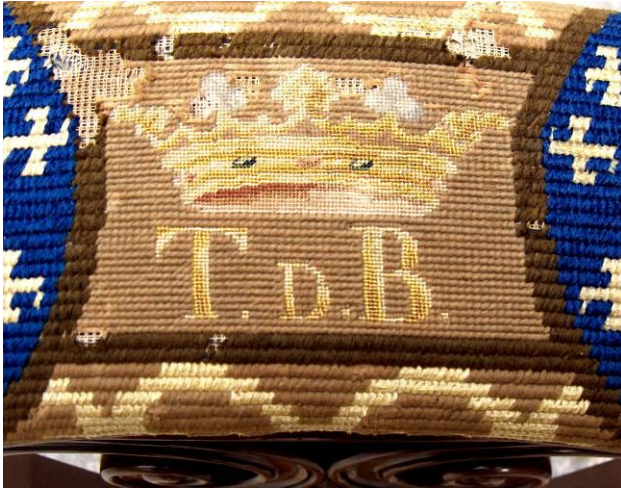
Detail van de initialen T.d.B. en de Franse markiezenkroon erboven.