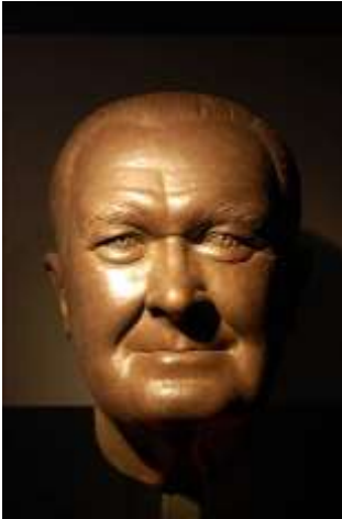
Dr. Paul Janssen