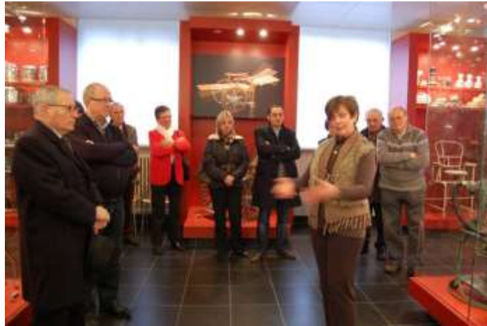
De Gids en zijn gehoor