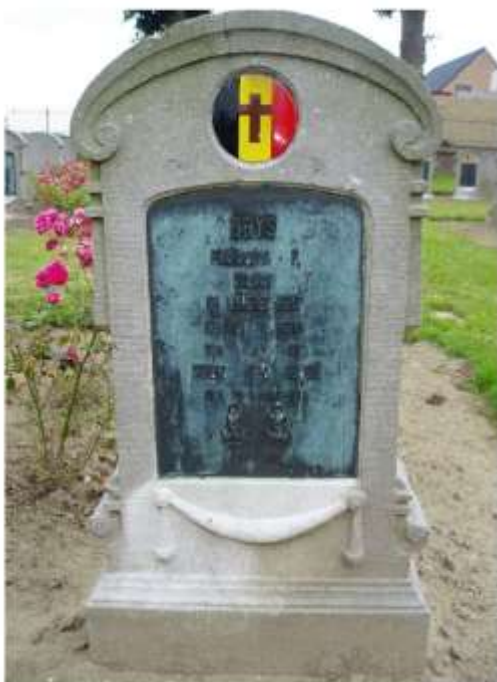
Graf op het Kerkhof van West-Vleteren

In het begin van de oorlog was het Belgisch leger helemaal niet voorzien op zoveel uniformen. In de eerste winter werd er van overal, o.a bij de Britse legers, uniformen bijeengeraapt