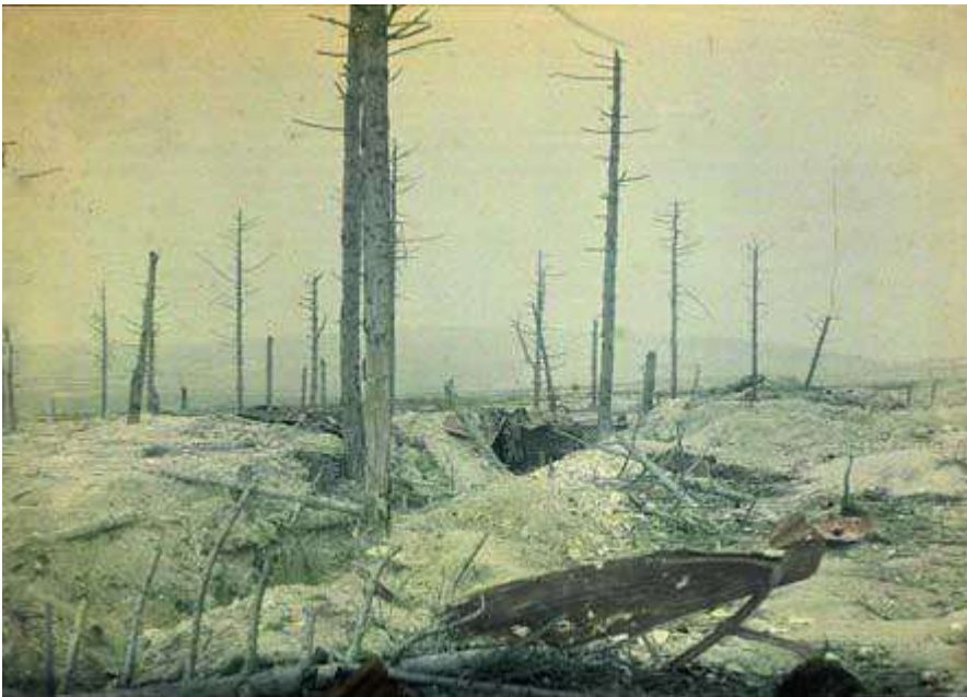
Landschap van de frontlinie in 1916

Op 25 maart 1916 sneuvelt hij te Steenstraete tijdens de “heilige wacht van de 6° linie”.