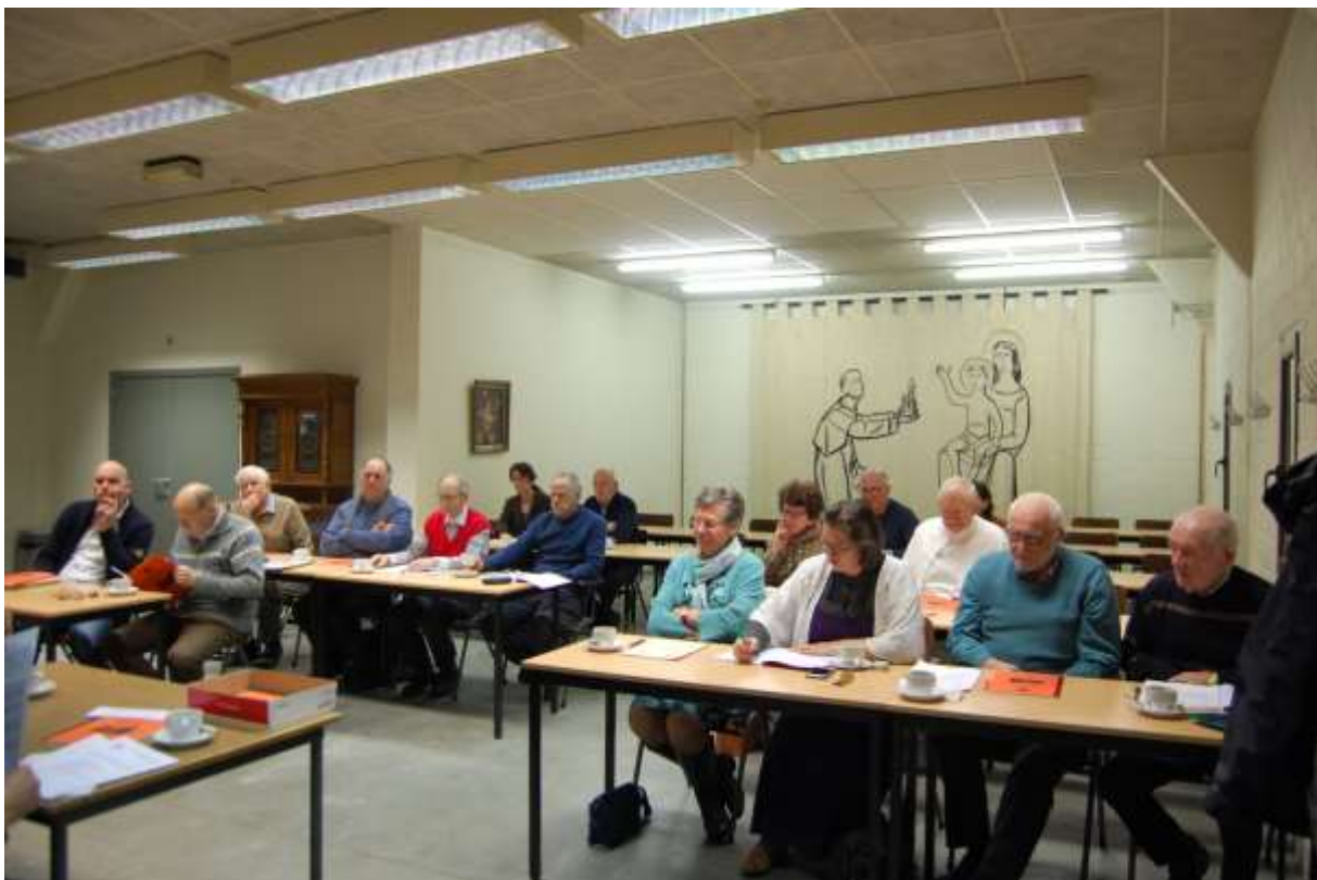
Foto 1 - Algemene vergadering in de Schaapskooi: deelnemers

De jaarlijkse algemene vergadering van Regio Kempen vond dit jaar plaats te Tongerlo. Pater Kees van Heijst, archivaris van de abdij , was zo vriendelijk om ons te ontvangen en te begeleiden. De vergadering vond plaats in de “Schaapskooi”, een vergaderzaal van de abdij en werd bijgewoond door twintig bestuurs- en andere leden van de vereniging.