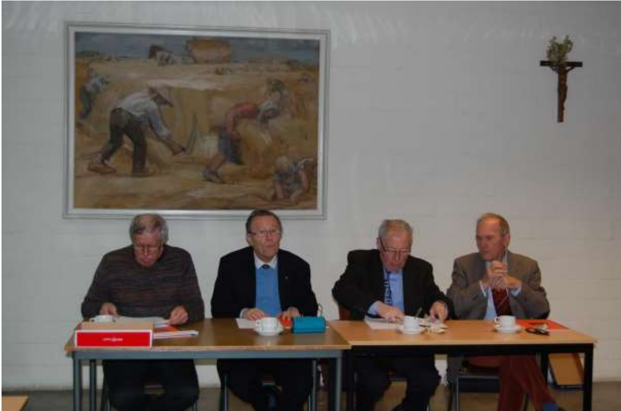
Foto 3 - Secretaris, voorzitter, penningmeester en ondervoorzitter. Zie de colofon om naam en/of e-mailadres te kennen.