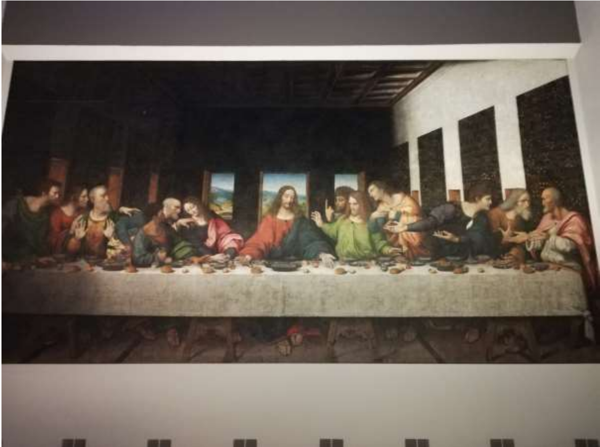
Foto 2 - Da Vinci's "Het laatste avondmaal" te Tongerlo

Ludo Lathouwers werd benoemd als nieuwe bestuurder in vervanging van Andre Van Steenberghe die in de loop van 2019 ontslag nam. Alle agendapunten werden met eenparigheid van stemmen goedgekeurd.